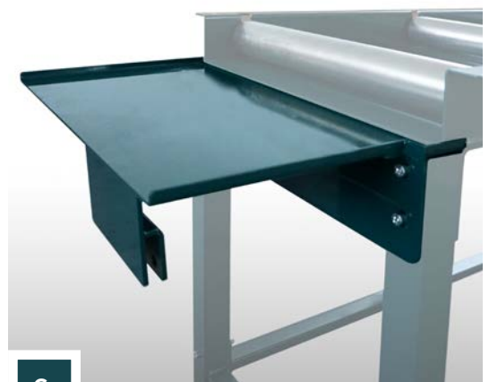
Koppelstuk type "C"