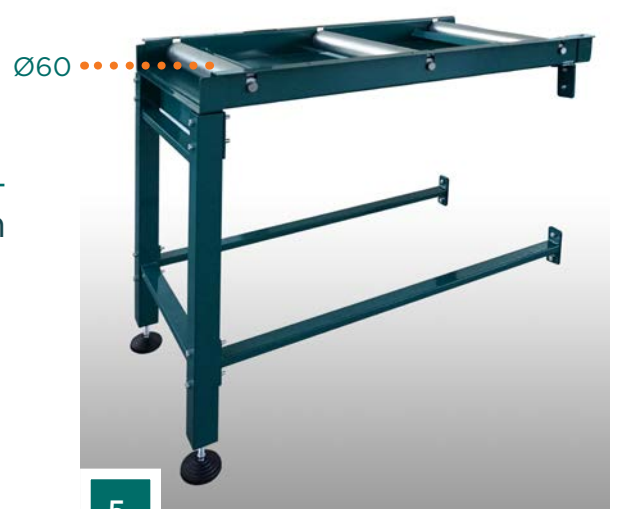
Rollenbanen type "B"