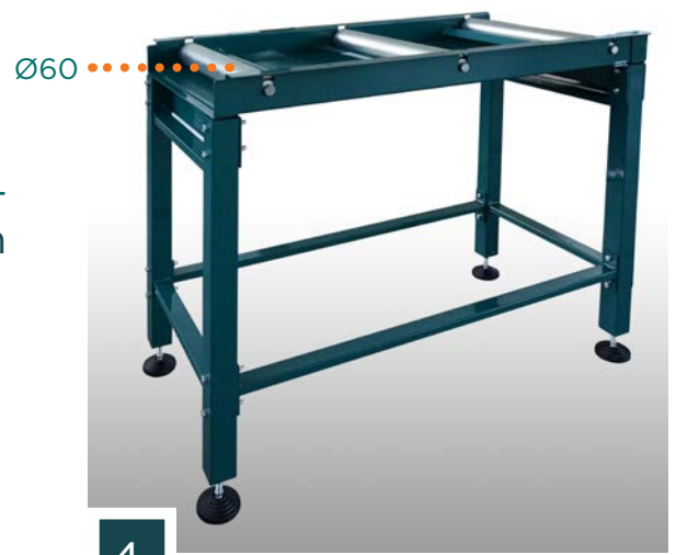
Rollenbanen type "A"